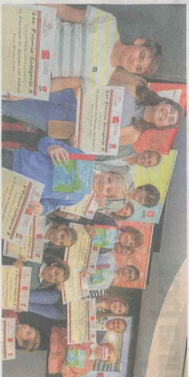
Los galardonados en el concurso.

lladolid, en un acto que contó con la presencia de los niños galardonados y sus familias. Los relatos ganadores se publicarán en un libro, con el apoyo de la editorial SM, que será el sexo de la colección. El certamen pretende animar a los más jóvenes a la lectura y a la escritura y fomentar la creación literaria entre los alumnos de la región.