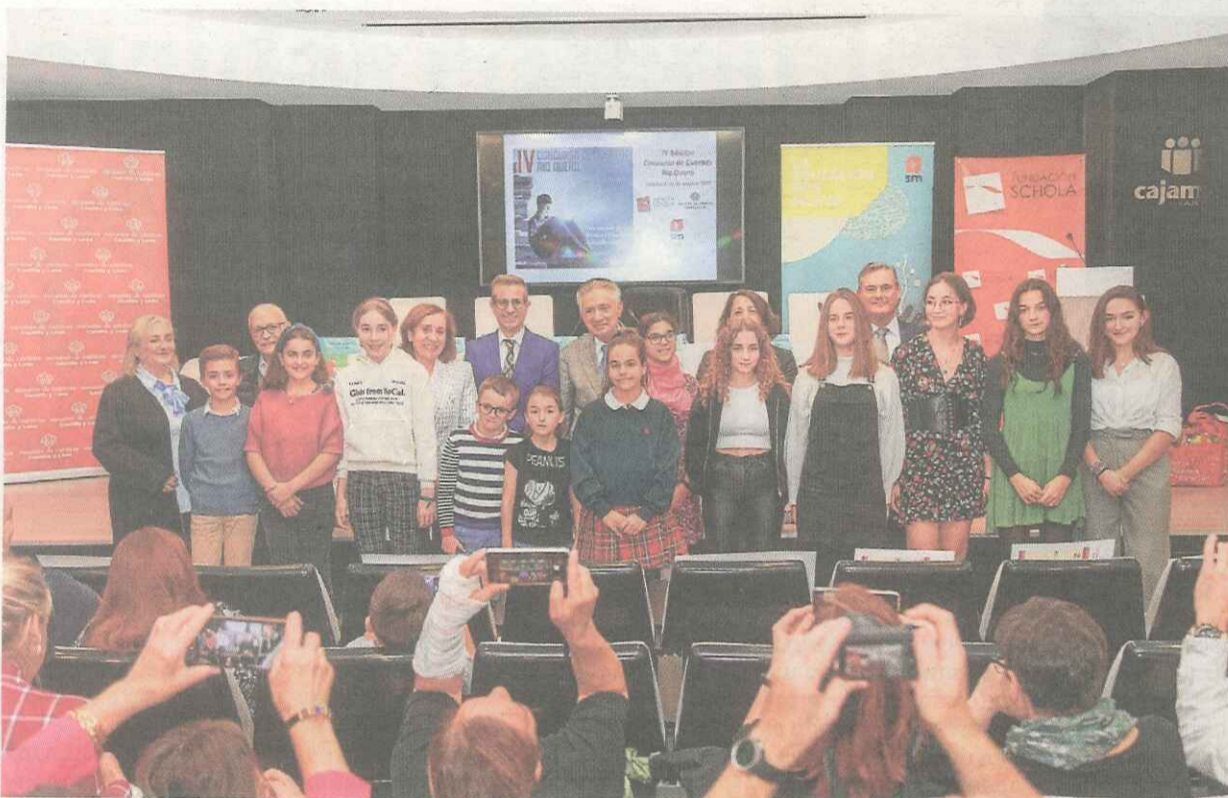
Foto de los premiados y miembros de la organización en la entrega de los galardones

Fundación Schola y Escuelas Católicas Castilla y León entregan los premios a doce alumnos de la Comunidad